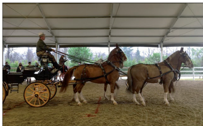
Même un attelage à quatre s'essaye à la marche arrière.