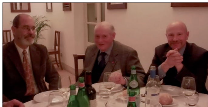
Les participants suisses au dîner