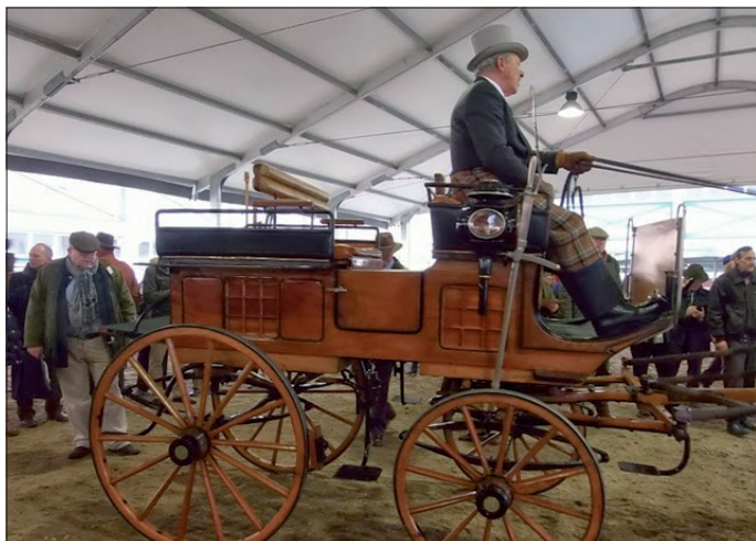
Deux attelages sur lesquels les discussions étaient ouvertes