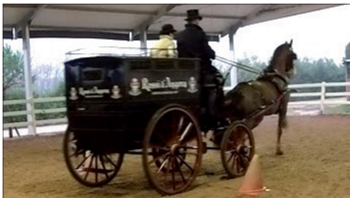
Réplique d'un véhicule commercial